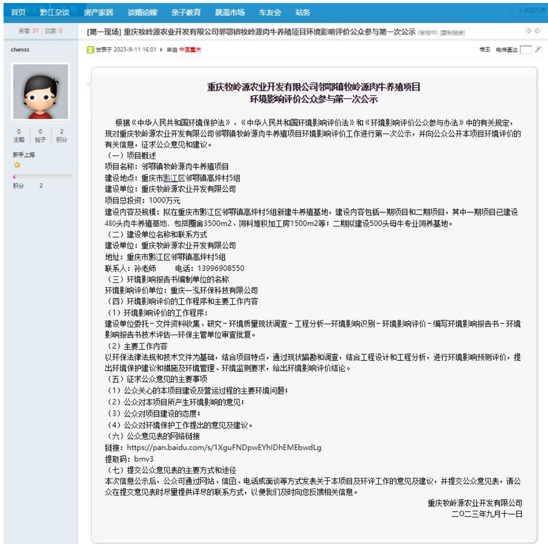
图 2-1 公众参与第一次公示照片