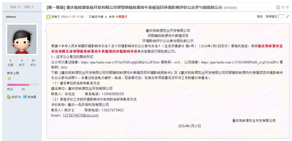
图 6-1 报批前公示截图

我单位在黔江网（公示网址：重庆牧岭源农业开发有限公司邻鄂镇牧岭源肉牛养殖项目环境影响评价公众参与报批前公示 https://www.qianjiangwang.com/thread-43165-1-1.html ）对该项目环境影响报告书全文和公众参与说明进行了公示，公示网页截图如图 6-1。