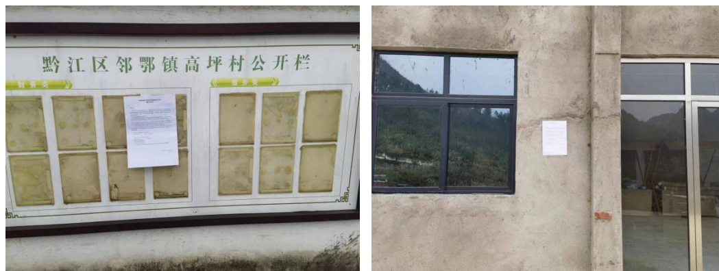
图 3-3 环评信息现场张贴公示图片